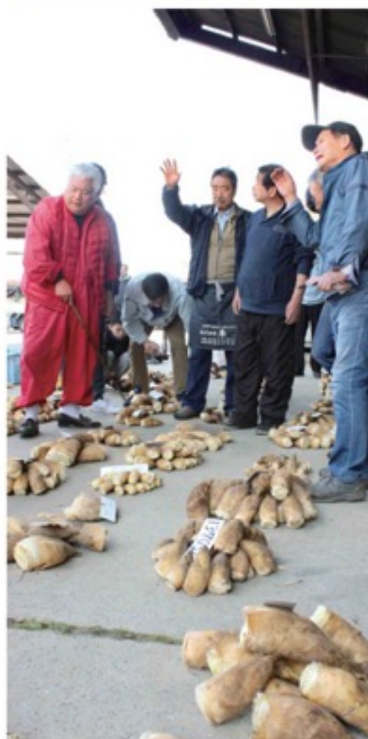
たくさんのタケノコが競り落とされます (昨年の様子)

JAでは、棚倉筈卸売市場へ出荷いただける方や部会に入り首都圏出荷をしていただける方を随時募集しています。詳しくはお近くのJA支店にお問い合わせください。