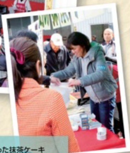
好評だった抹茶ケーキ