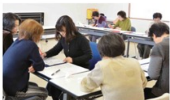
先生の指導を受ける参加者

私たちペン習字サークルは月1回、第2水曜日に和気あいあいと楽しく活動しています。現在、定員オーバーになるくらい、同支部サークルNo.1の人気サークルです。京田辺市産業祭で毎年展示していますので一度ぜひご覧ください。