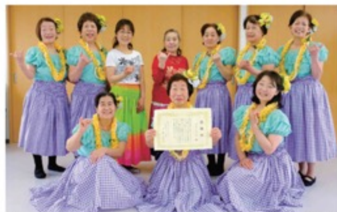
特別養護老人ホーム楽生苑(久御山町)で行われた楽生苑開設20周年式典で久御山町支部フラダンスサークル「ブルービーチ」が感謝状を受けました。

平成31年度の活動計画のテーマは「JA女性 みんなで輝こう 地域とともに」で、重点活動として新たに、女性部組織の拡充強化の具体案として①青壮年部の配偶者への加入促進運動②女性部味噌作りを通じた新規部員獲得運動がもりこまれ