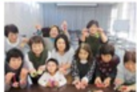
可愛いアロマワックスができました

細かい作業が大変な時もありますが、作品ができ上がると毎回とても嬉しく、作品ができ上がると毎回とても嬉しく、作品ができ上がると毎回とても嬉しく、作品ができ上がると毎回とても嬉しく、