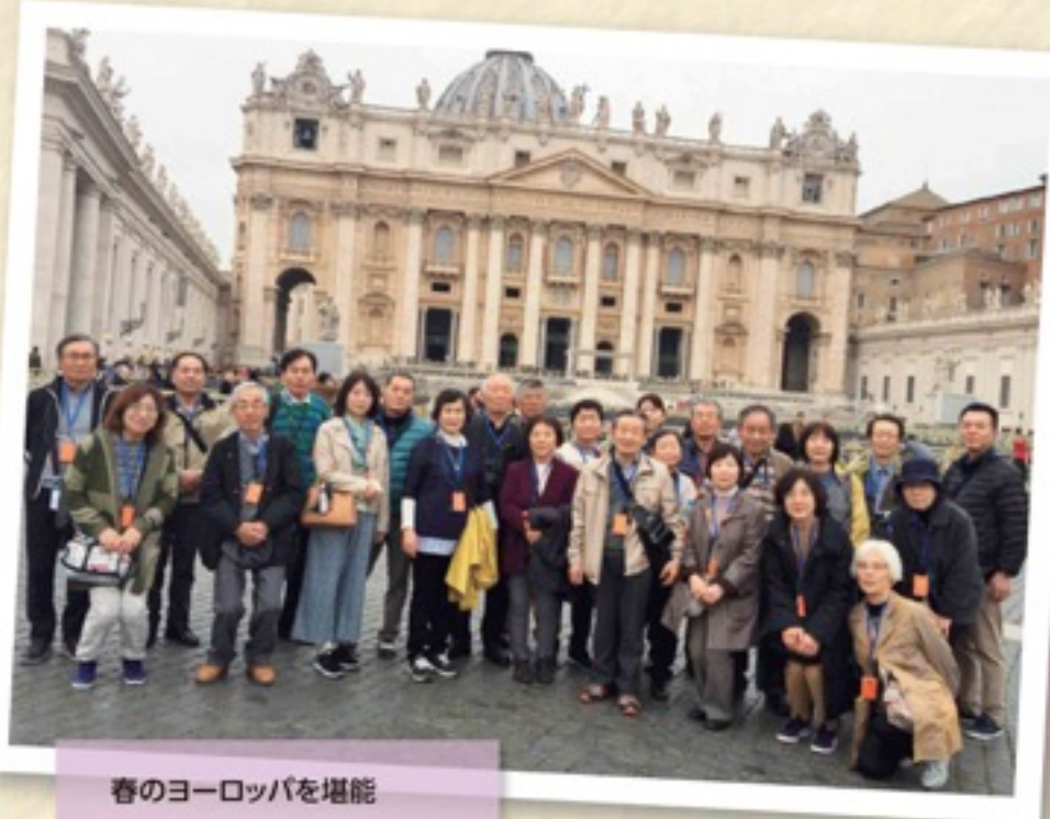
春のヨーロッパを堪能