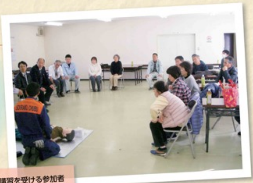
真剣に講習を受ける参加者

参加者は、「いざという時に何もできないのでは困ります。今日は最低限必要な知識を得ることができました」と話しました。