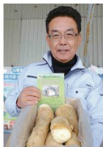
今年も首都圏へ出荷