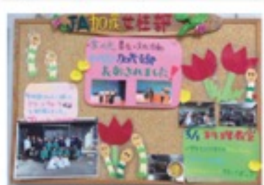
活動の様子を掲示

加茂支部は現在32人で活動しています。手芸やお料理、お花の寄せ植えなど一人一人得意な分野を生かし、活動の輪を広げ、和気あいあいと楽しんでいます。