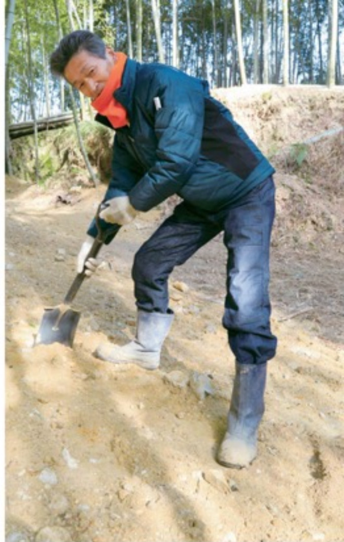
入念な土入れ作業