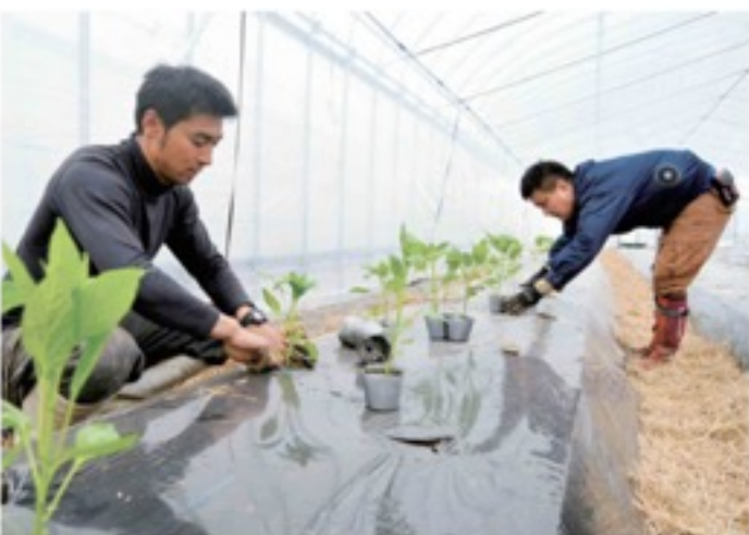
配布当日に定植をする部会員

万願寺とうがらしをはじめとする京野菜の産地拡大に向けたパイプハウスリース事業の展開により、平成31年現在、万願寺とうがらし部会は部員78人、栽培面積は5・5haに拡大しています。