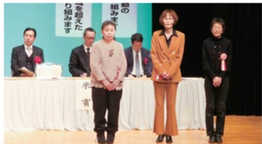
家の光普及活動が評価

2月26日、「第68回 J A京都府女性大会・平成30年度京都府家の光大会」が京都テルサ（京都市南区）で開かれ、府内の女