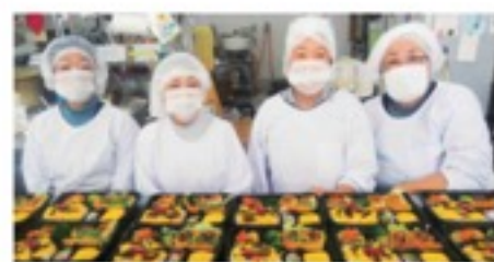
おいしいお弁当ができました

お時間の空いておられる方はぜひ当加工部で力を発揮してみませんか。お待ちしております。