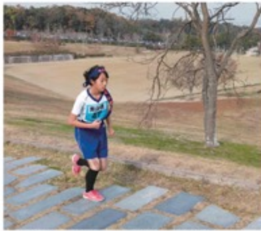
やましる未来っ子小学校EKIDENIに選出

小学3年生の時に「やまぞえ布目ダムマラソン大会」に初めて参加し上位に入ることができました。それがきっかけで走ることが楽しくなり5年生の時、「南山城小学校マラソン大会」で1位になることができました。平成30年12