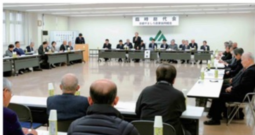
賛成多数で承認を得た臨時総代会

これを受けて、当JAでは、組合員の皆さんを対象に、4月以降組合員資格のご確認をお願いすることとしておりますので、ご理解願います。詳細につきましては、お近くの各支店にお問い合わせください。