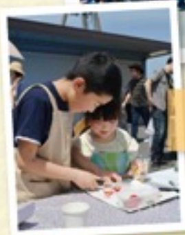
仲良く イチゴスイーツづくり