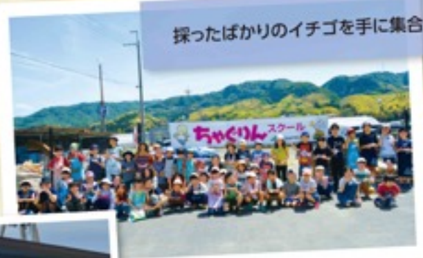
採ったばかりのイチゴを手に集合