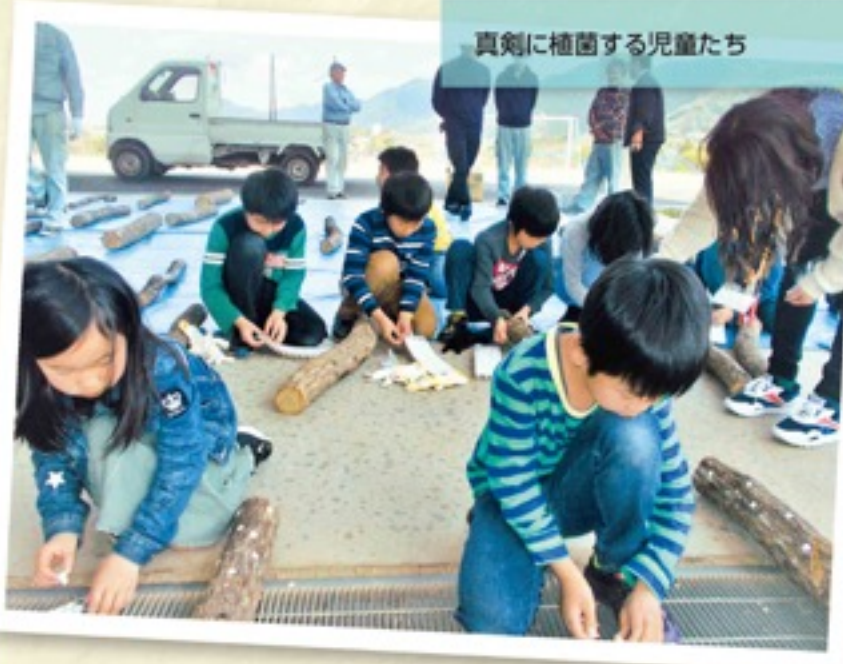
真剣に植菌する児童たち