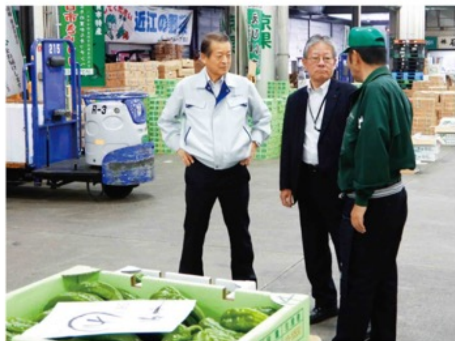
十川組合長らが市場を訪問