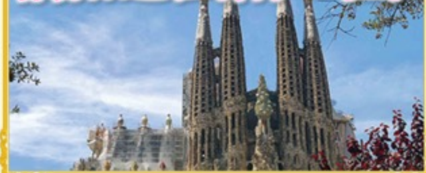
サグラダ・ファミリア Sagrada Família