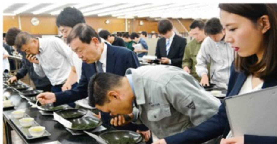
茶商が品質を確認