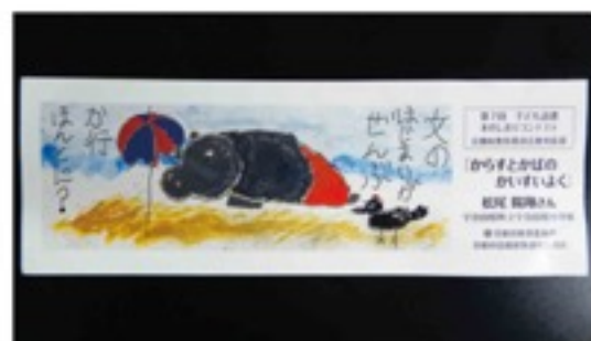
第7回子ども読書本のしおりコンテスト最優秀賞

できず、くやし かったこ とを覚え ていま す。それ を機に、 もともと 絵を描く ことが好 きなこ