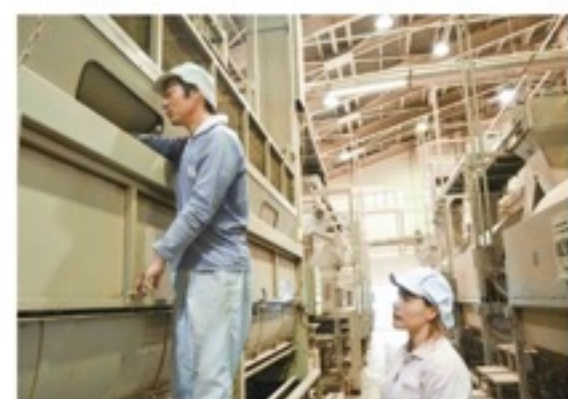
機械の稼働をチェック

を低コスト化・省力化して大量生産・均二品質を目指そうと、当時の茶農家16人が全自動の茶加工工場「農事組合法人「グリーンティー高尾製茶工場」を立ち上げ、共同利用を開始しました。