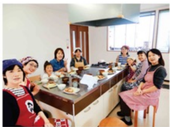
美味しくできました

フレッシュユミズ活動第2回は5月28日、イチゴジャム作りを開催します。参加申し込み、お問い合わせは本店総合企画部ふれあい課 (TEL 0774-62-1200)まで。