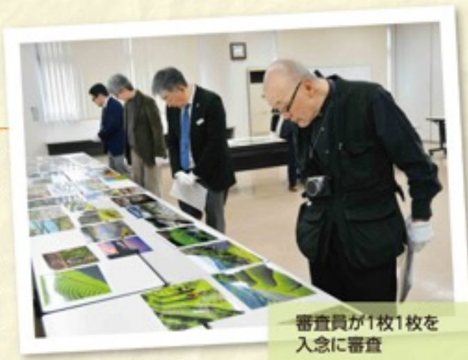
審査員が1枚1枚を 入念に審査

コンテストは、農業・農村の役割やJAに対する理解を写真を通じて深めてもらおうと毎年開催。第24回においても、令和の時代に受け継ぐ美しい山城の風景の写真をお待ちしています。