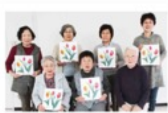
可愛いちぎり絵が完成