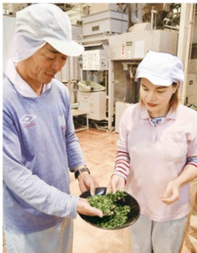
茶の仕上がりを確認