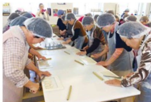
神戸へ日帰り旅行 みんなでかまぼこ作り (4 / 16・木津川市支部)