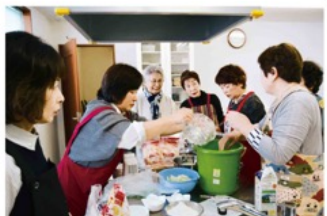
ゴクリ団子づくり (4 / 22・京田辺支部)