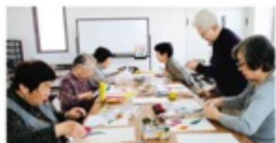
おしゃべりをしながら楽しく作業