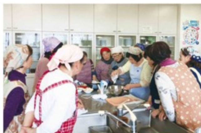
家の光レシピを使った料理教室 (5 / 10・加茂支部)