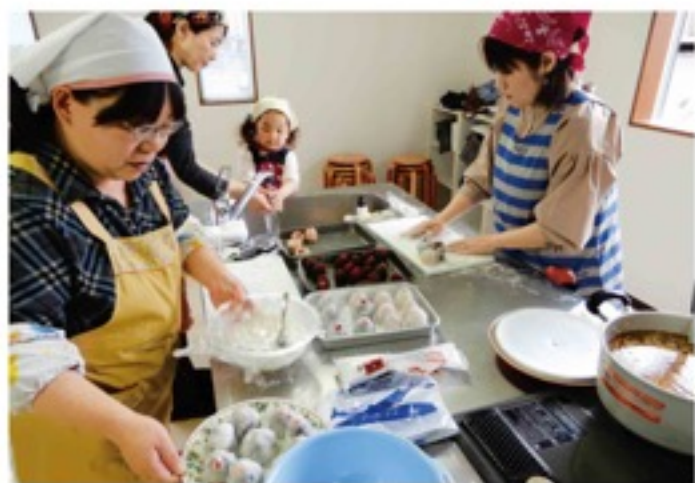
親子でイチゴ大福作り

当に電子レンジで簡単にできました。これなら子どもと一緒に作るができます」と話しました。