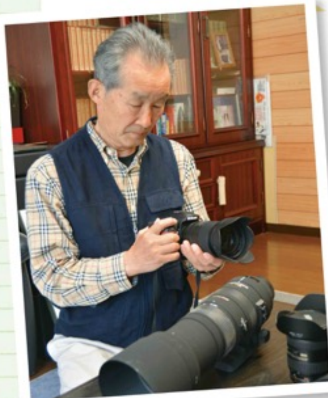
※フォトコンテスト優秀賞作品はP14でご紹介

次回の第24回フォトコンテストに良い写真が応募できるよう、今後も楽しみながら撮影を続けていきたいと思っています。