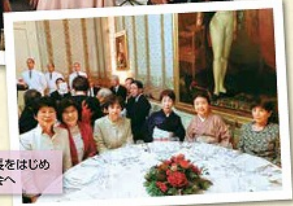
女性部の植村部長をはじめ女性部員も晩餐会へ