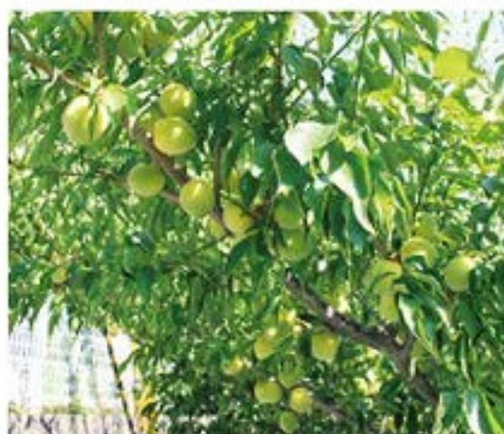
城陽市特産の梅「城州白」