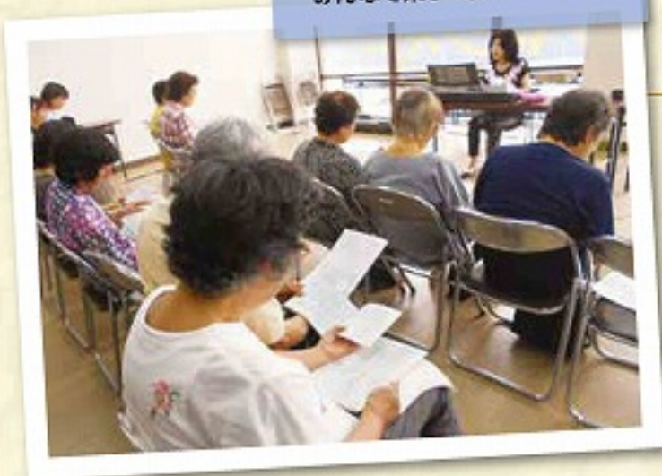
みんなで楽しく歌いましょう