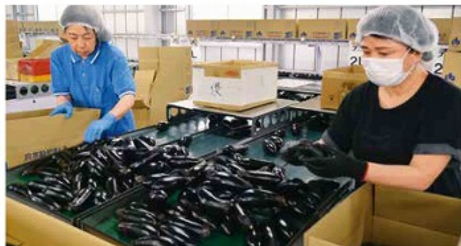
選果場箱詰め作業の様子

州水ナス部会を訪問し、ナス栽培方法や生産における情報を交換。またナス農家養成塾による新規栽培農家の掘り起こしに力を入れるなど、京都田辺茄子の生産振興に努めていきます。