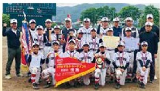
33年ぶり、久御山バッファローズ優勝

僕は先発ピッチャーとして5イニングを投げ切り、友達との長鳴くに引き継ぎました。小学1年生の時に野球を始め、から6年