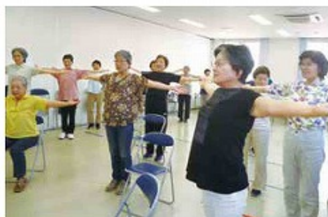
元気でまっせ体操で健康に (6/13・精華町支部)