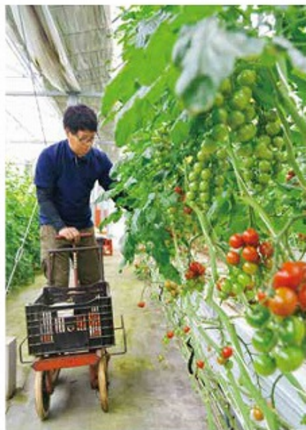
トマトの収穫には根気が必要