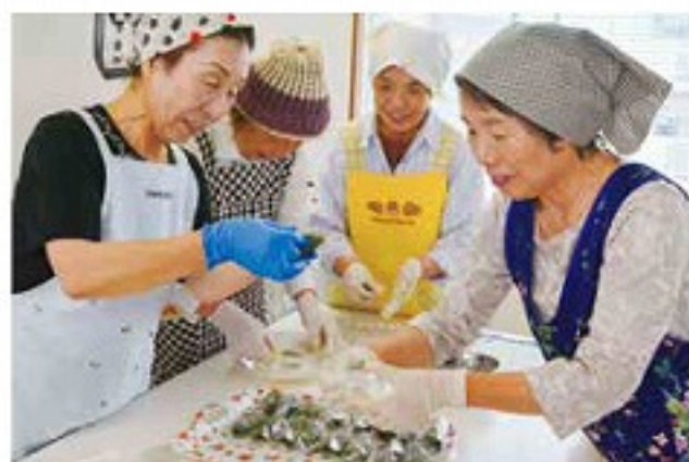
楽しくよもぎ団子づくり (5/29・京田辺支部)