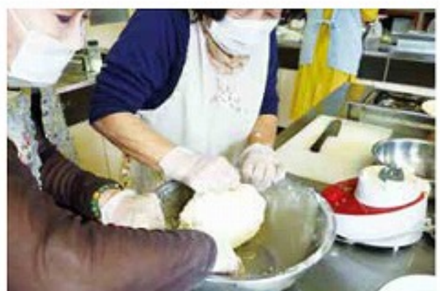
ゴキプリ団子づくり (5/17・井手町支部)