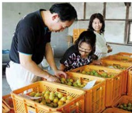
城州白の出荷の様子