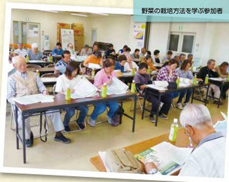
野菜の栽培方法を学ぶ参加者