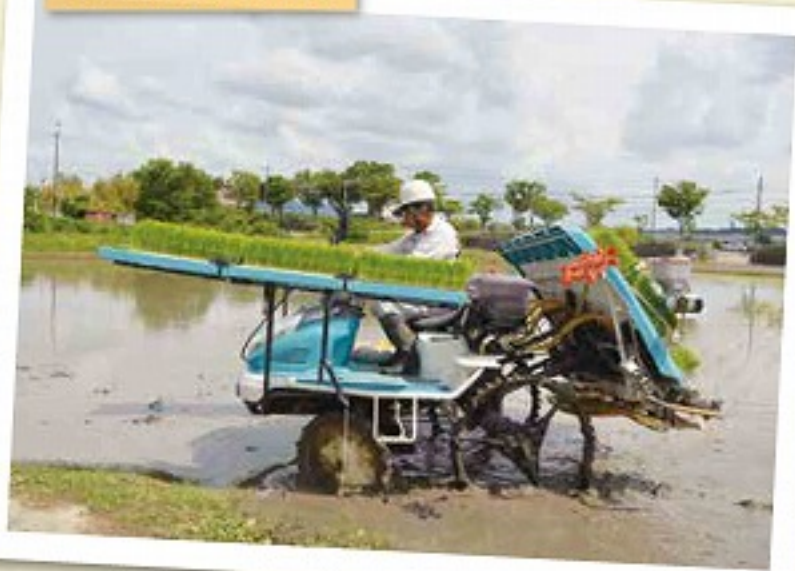
田植えに取り組む特別栽培米部会部会員