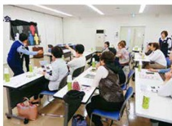
交通安全と特殊詐欺被害防止対策の講習会

介護サービス、七夕のつどいやクリスマス会といったミニデイサービスを展開し、地域の高齢者同士の交流の場を提供していくことを申し合わせました。