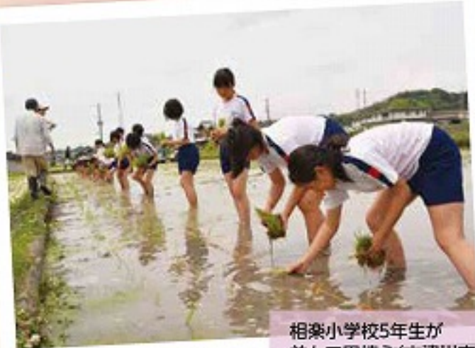
相楽小学校5年生が 並んで田植え(木津川市)

秋には収穫作業も行われ、それぞれの小学校のお祭りやイベントで食べられる予定です。