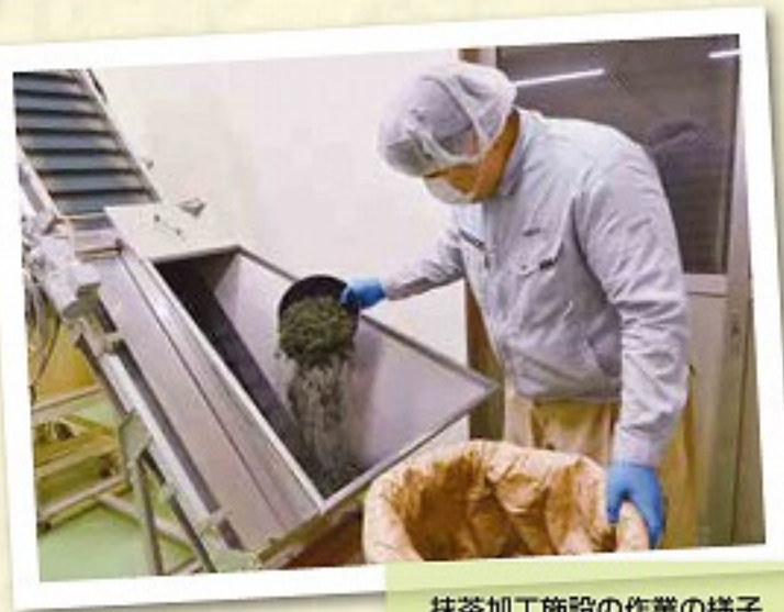
抹茶加工施設の作業の様子

抹茶の原料となるてん茶において今年、初茶てん茶は選択買いの傾向が強くなりました。2茶についても同様になると予想されており、化成肥料等施肥の上、防除をしっかり行い、覆い不足、刈遅れにならないよう生産者に管理をお願いしています。また、収穫時には古葉等が入らないよう注意をお願いします。