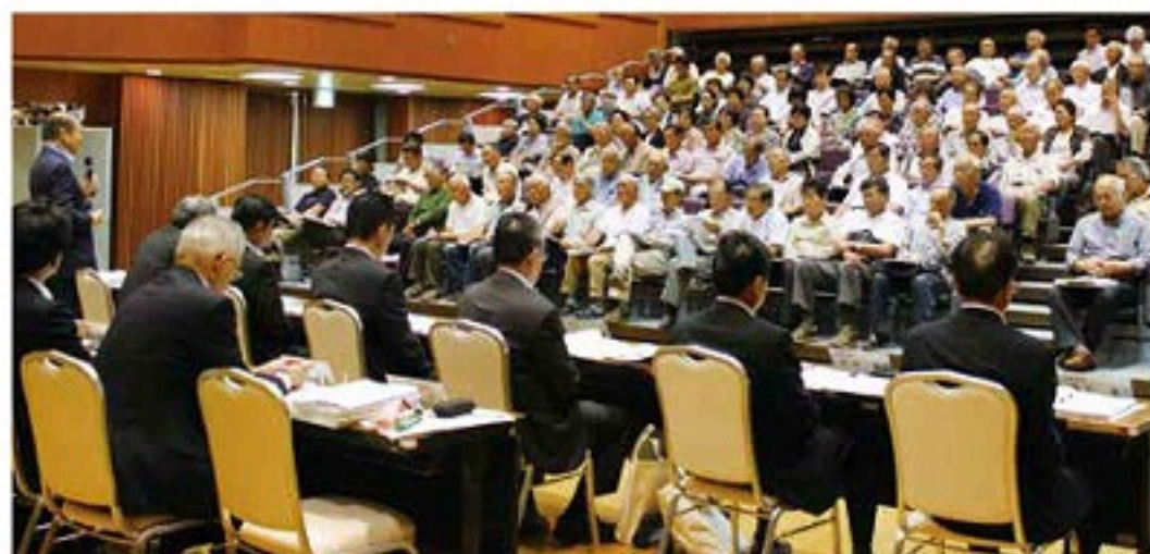
3会場で懇談会を開きました

状と今後の見通しについて解説や農業機械の操作勉強会の開催を求めるなどの意見と要望が寄せられ、役員がそれぞれに回答しました。