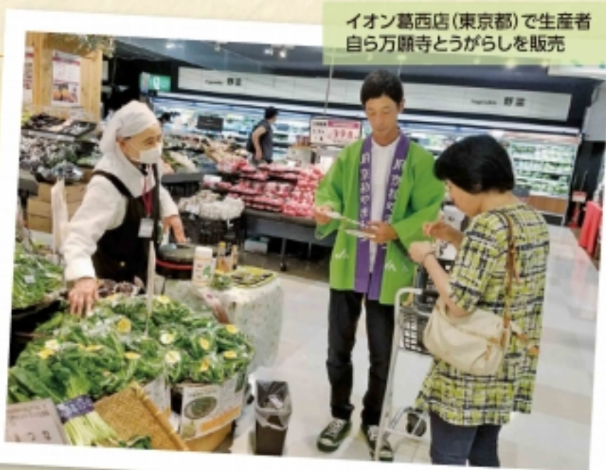
イオン葛西店(東京都)で生産者自らが万願寺とうがらしを販売

6月14日に大丸京都店で、21日には東武百貨店、22日には東京のイオン葛西店で生産者自らが万願寺とうがらしを販売。店頭では試食を実施、お客さんに直接、京都やましろの新鮮な野菜の味をお届けしました。