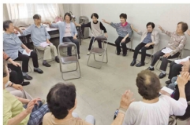
笑って楽しくみんなで体操 (6 / 27・宇治市支部)