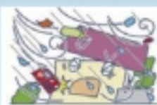
風災 (台風・暴風雨など)