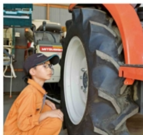
大きなホイールが大好き

小学校2年生の時、お父さんといっしょに行ったJA全農京都山城農機整備センター(城陽市)でたくさんさんの農機具に出会いました。JA職員さんの農機具のお話もおもしろくて、それ以降農機具が大好きになり、家