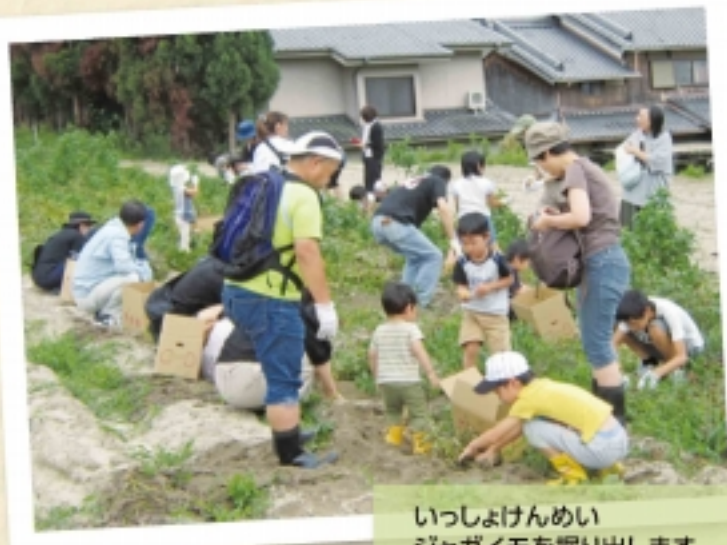
いっしょけんめいジャガイモを掘り出します