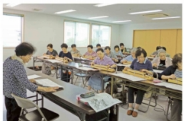
大正琴の音が響く (7 / 8・久御山町支部)