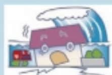
地震などによる津波