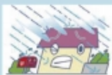
水災 (台風・豪雨などによる洪水)