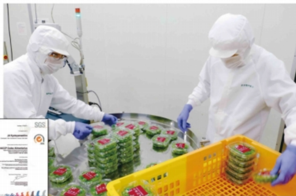
ネギカットセンターがSGS HACCP認定加工場になりました

J Aでは開設当初から、HACCPの運用方法手順の順守とアルバイトを含む職員研修会の定期的な実施や衛生管理および毎日の作業記録・確認など徹底した労働管理に取り組んできました。昨年3月には京都府が定める「きょうと信頼食品登録制度」の登録を受けています。