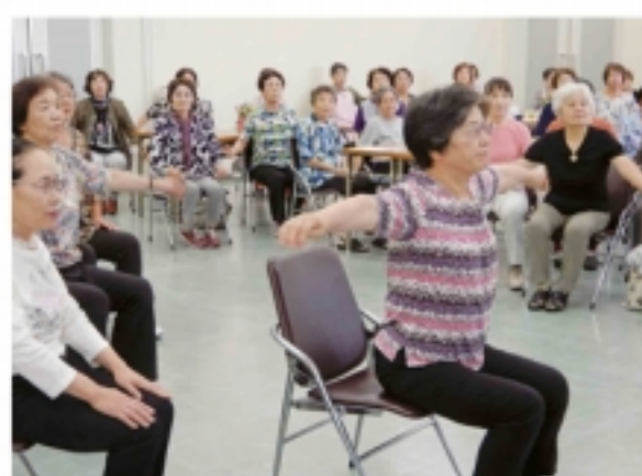
元気でまっせ体操が大好評 (城陽市)

12日には城陽支店で「夏祭り」を開催。市内のフラダンスグループがフラを披露しました。また、女性部精華町支部の体操サークルが「元気でまっせ体操」を参加者に手ほどきしイベントを盛り上げました。