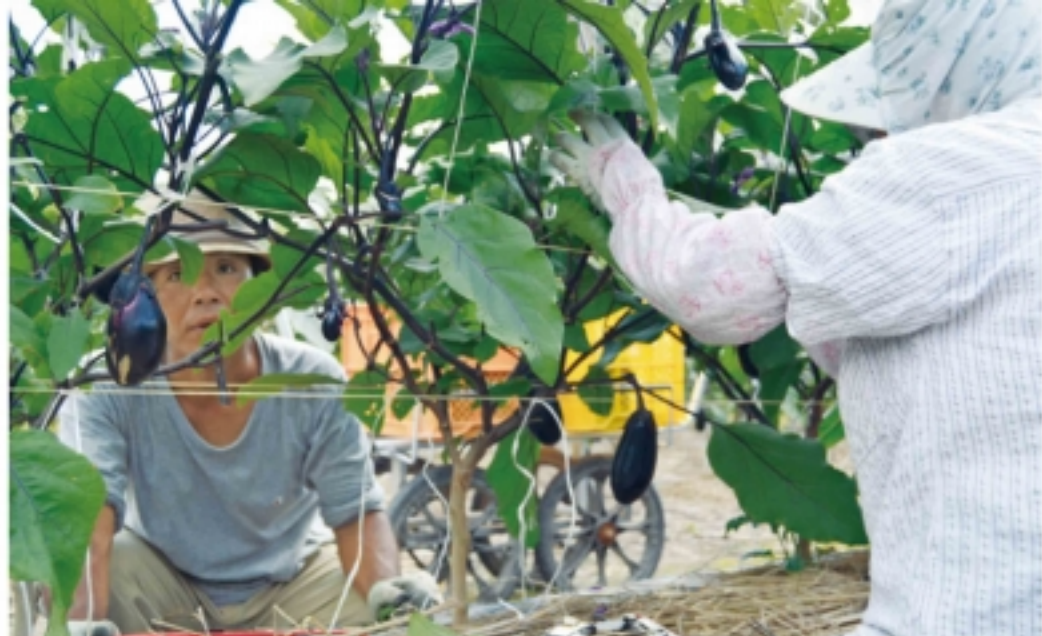
お互い作業を確認

恵一さんは、就農したすぐは苦勞が多かったとい います。 「京都田辺茄子の産地 として歴史のある田辺に 実家があるので、近くの ナス農家を営む方々に栽 培の方法を教わることに できました。またJAの 茄子部会の先輩方には今