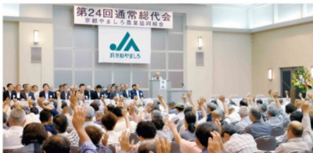
全8議案が可決承認されました

基盤強化計画の設定や定款の一部 変更に基づく監事監査規程の一部 変更について、会計監査人の選任 についてなど8議案を審議、全議 案可決承認されました。