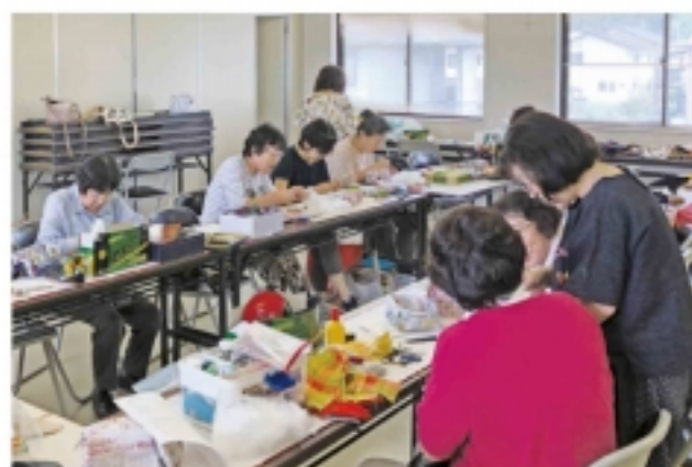
おしゃれ足袋づくり (6 / 28・加茂支部)