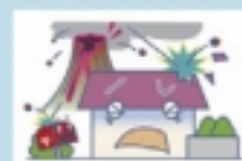
火山の噴火・爆発