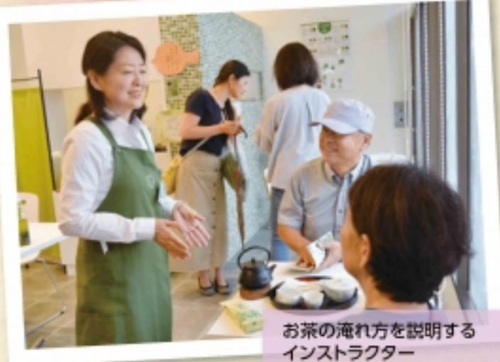
お茶の淹れ方を説明するインストラクター