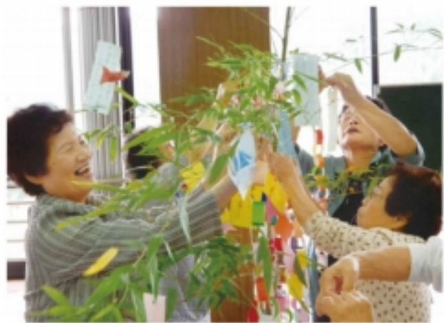
短冊に願いをこめて (宇治田原町)

集まった地域の高齢者38人は、短冊に願い事を書いたり、女性部宇治田原町支部の大正琴演奏を楽しみました。