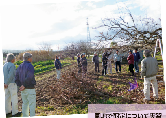
園地で剪定について実習

「今年はより管理を徹底し良質な柿を生産し、収穫量アップを目指そう」と参加者同士で意志確認しました。