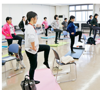
音楽に合わせてゆるやかに運動

参加者からは、「ゆっくりとした運動で無理もなく、とても身体がすっきりしました」と声があがりました。