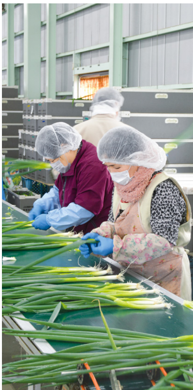
九条ねぎ調整包装施設作業の様子

一方、ネギ調整包装施設には、ネギ部会員から毎日1000kgの九条ねぎが持ち込まれています。暖冬の影響から九条ねぎの生長が