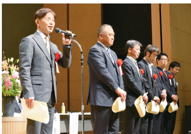
表彰される歴代青壮年部部長

青壮年部では現在、各支部・地域の農業における、耕作放棄地対策や労働力確保、鳥獣害対策など、