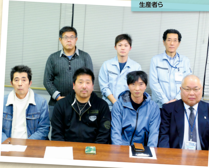
新しく部会を立ち上げた 生産者ら