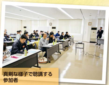
真剣な様子で聴講する参加者