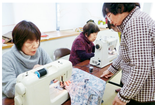
おしゃれもんぺ作り (1 / 29・井手町支部)