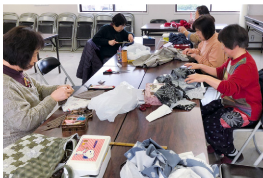
おしゃれもんぺ作り (2 / 14・加茂支部)