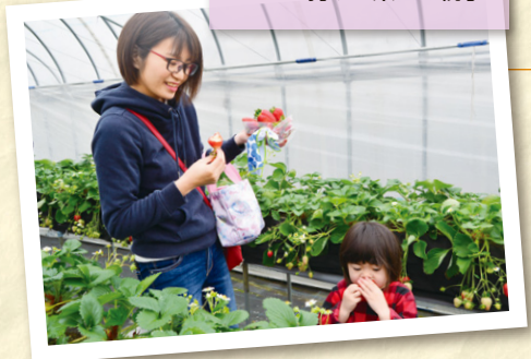
いちご狩りを楽しむ親子