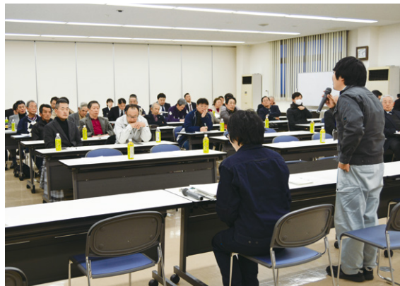
茄子生産拡大をめざしアドバイス

ローバルGAP（農業生産工程管理）の取得に向けて3月中旬に審査を予定しており、今春の取得に向け最終段階を迎えています。