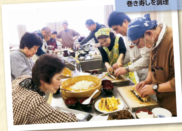
男女が協力し 巻き寿司を調理