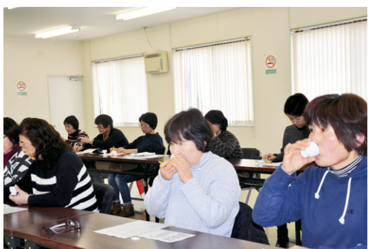
女性部茶香服大会 (1 / 24・和束町支部)